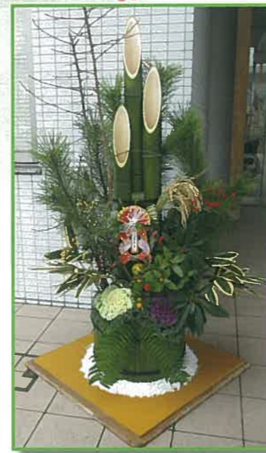
職員手作りの門松です。 毎年工夫をこらしています。